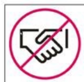
3. Kontaktfreies Training, kein Abklatschen