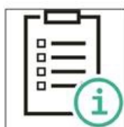
1. Gruppenleiter und Trainingsgruppe dokumentieren