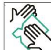
5. Desinfektion der Bälle während und nach dem Training