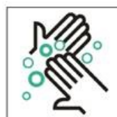
4. Handdesinfektion vor und nach dem Training